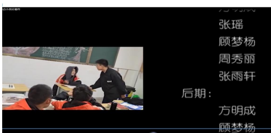
图 1 拍摄花絮

在教学中，以微视频拍摄任务为驱动，对于学生存在的问题，有针对性的答疑解惑，逐步引导学生完成微视频主题构思，视频剪辑，后期包装，微视频答辩。