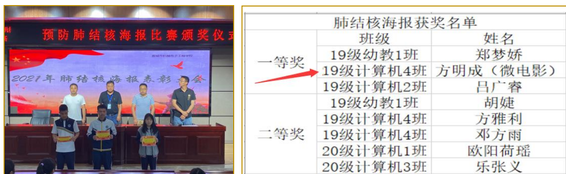
图4 防疫主题微电影获奖

课程制作以立德树人为目标，微视频的主题是防疫、身边的好人好事，同学们关注身边的好人好事、关注卫生健康。青少年正处于生理和心理发生巨大变化的时期，拍摄微视频弘扬正能量，教育青少年树立正确的人生观和价值观。青年人是国家的未来，民族的希望，引导青少年树立远大理想，树立和践行社会主义核心价值观。