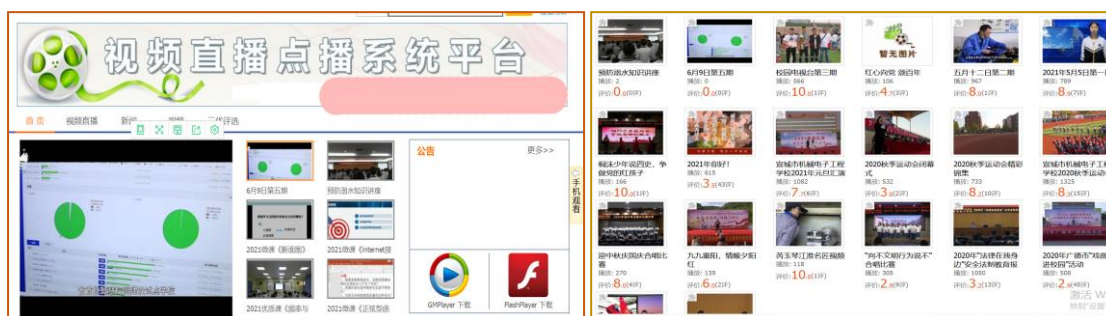
图2 部分学生作品展示

在教学过程中，坚持理实一体化教学，取得了良好的教学成效。学生学习完十六课时后掌握了微视频制作的相关技术，制作了微视频短片，优秀作品学生推荐参加信息素养实践比赛、肺结核防治宣传视频比赛，取得了不错的成绩。部分学生还参加了校园电视台工作，承担了校园新闻拍摄、视频剪辑、后期配音等工作，学生们独立制作的校园新闻作品上传至校园网，学校公众号，微信视频号，抖音等平台，对校内重大事件进行播报，弘扬爱国主义精神，开展系列主题报道，也帮助我校对内对外宣传。